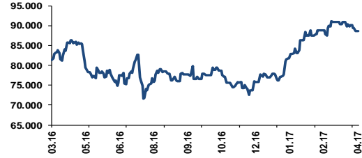
CDS (5 Yıllık)

Yurtdışı piyasalarda Trump politikalarına yönelik artan şüpheler ve bugün başlayacak Trump-Çin görüşmesine yönelik gelişmeler ön planda. Bu doğrultuda dün akşam Temsilciler Meclisi sözcüsü, Cumhuriyetçi Paul Ryan'ın vergi reformu konusunda görüş birliği olmadığı ve görüşmelerin beklenenden daha uzun sürede gerçekleşebileceğine dair açıklamaları soru işareti yarattı. Güne yükselişle başlayan ABD endeksleri satış baskısı altında kalırken (VIX %9 yükseldi), ABD tahvil faizleri/dolar endeksinin gerilediğini takip ettik. (10 yıllık tahvil faizi 4 baz puan geriledi). Gelişmekte olan piyasalarda döviz kurları satış baskısı altında kalırken, Brezilya hisse senetleri %1.5 civarı ekside kapanış yaptı. Yurtdışı piyasalarda ise TL'de satış baskısı ön plandayken, BIST-100 endeksinde 88.000 desteği üzerinde tutunma çabası etkili olmaya devam ediyor.